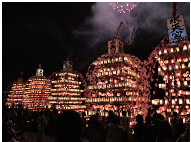
寄居玉淀水天宮祭の舟山車