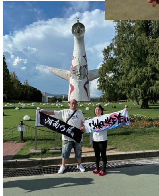
大阪 湘南乃風 野外ワンマンライブ